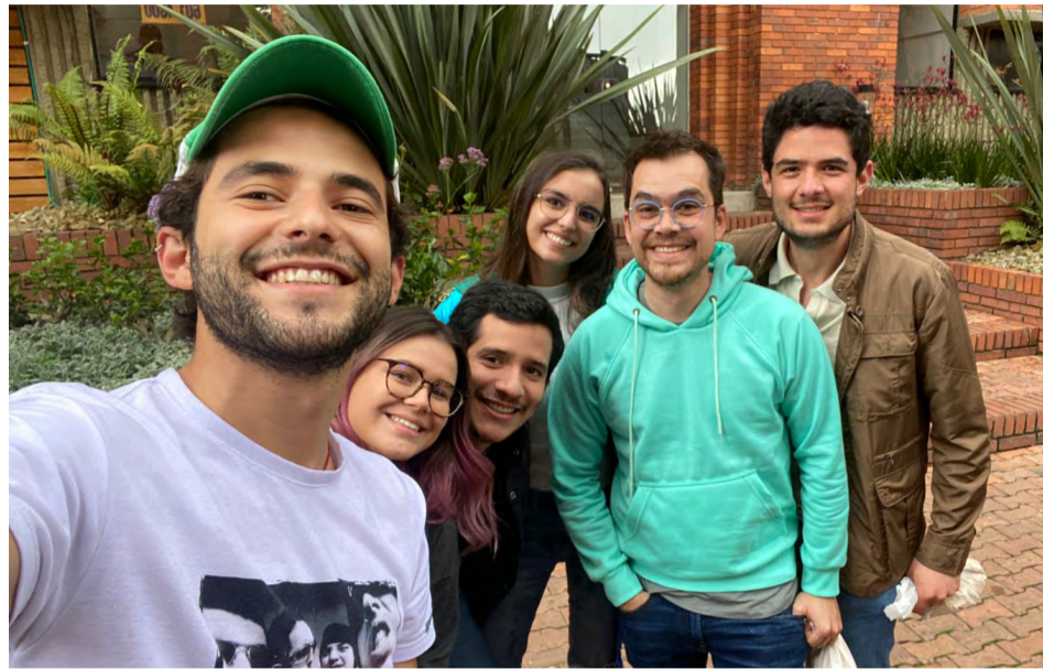
La selfie es prueba fehaciente de la felicidad de todo el equipo.

Con todos a bordo, comenzamos nuestro recorrido alrededor de las once de la mañana. Sin haberlo intentado, el plan fue lo más capitalino posible. Fuimos víctimas de lo más cliché de un día sabatino bogotano: sol, lluvia, otra vez sol, otra vez lluvia, y un único trancón que siempre estuvo presente; aunque también pasado, muy pasado. En el pro-